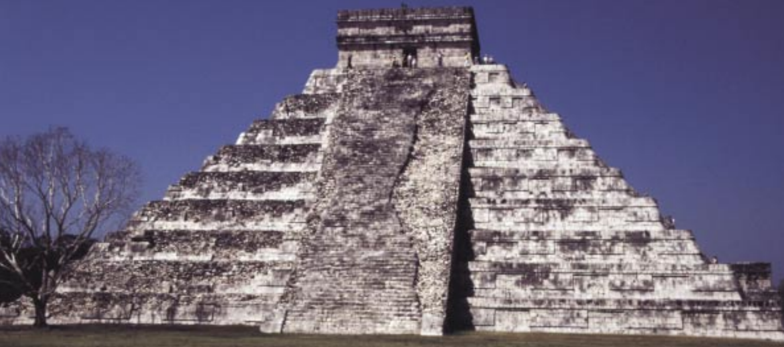
Die Pyramide El Castillo von Chichen Itza verkörpert den Berg, an dem nach der Entstehung des Universums der Mais erschaffen wurde.

schaffung der Welt keineswegs alle auf dem Wert null. Ab dem Zyklus Bak'tun zeigten vielmehr alle höheren Zähler bis hin zur 20. Stelle über K'atun den Wert 13. Das berichten insbesondere drei Stellen aus dem Ort Coba im mexikanischen Bundesstaat Quintana Roo. Die höchste Einheit in diesen Texten umfasst 2021 Jahre zu 360 Tagen. 13 solcher gigantischen Kalenderzyklen waren den Inschrif-