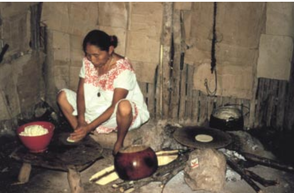
Mayafrau bei der Zubereitung von Tortillas (Maisbrot). Die Feuerstelle rechts von ihr besteht aus drei Steinen – auf einer solchen Feuerstelle entstand dem Mythos zufolge auch die Welt. Die Feuerstelle bildet seit tausenden Jahren das Herz eines Mayahauses.

Eine Besonderheit der Mayazeitrechnung war nun, dass der Zahlkoeffizient des Bak'tun sich nicht von 13 zu 14 veränderte, sondern auf 1 zurücksprang, also von 13.0.0.0.0 für den Schöpfungstag auf 1.0.0.0.0 bei der Vollendung des ersten Bak'tun (15. November 2720 v. Chr.) nach der Schöpfung. Lange Zeit wurde daraus die Erwartung eines Weltendes abgeleitet, denn der Koeffizient der Bak'tun-Einheit wird nach 13 Zyklen wieder den Wert 13 annehmen und dieses Datum steht am 23. Dezember 2012 bevor. Tatsächlich gibt es aber keinerlei Indizien dafür, dass die Maya erwarteten, das Ende der Welt stünde zu diesem Zeitpunkt bevor. Unter den vielen tausend erhaltenen Inschriften ist nur eine bekannt, die Anga- ▶